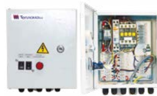
Блок-WA (ver. E)